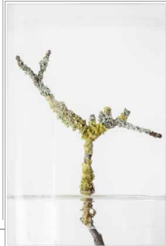
Bilder von Gewächsen, Blättern, Wurzeln, Stängeln, sich Verzweigendem, Schlaffem, in eine Richtung oder mehreren Richtungen Weisendem.

Die Ausstellung „FLORA PHOTOGRAPHICA. Metamorphose im Zwischenraum. Fotografien von Petra Lutnyk ist von 26. Juni bis 6. Oktober 2019 im Saal 50 zu sehen.