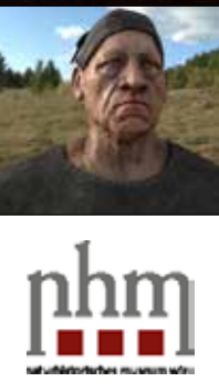
nhm naturhistorisches museum wien