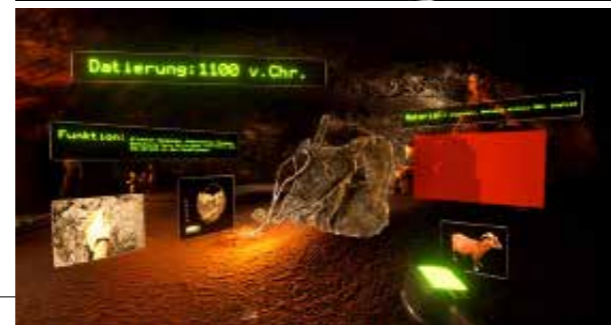
Im VR-Raum werden die notwendigen Zusatzinformationen zu den Werkzeugen der Bergleute erfahrbar.