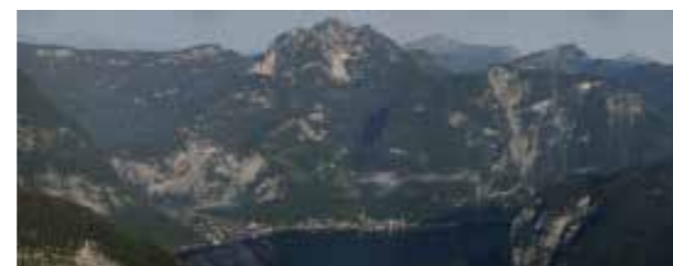
Hallstatt und der Ortsteil Lahn. Darüber liegt das Salzbergtal.

Die Ergebnisse dieser Arbeiten sind verblüffend: Im Hallstätter Salzberg verbergen sich die größten prähistorischen Abbaukammern, die weltweit bekannt sind. In der Hallstattzeit (um 700 v. Chr.) können durch die Forschung horizontale Hallen erschlossen werden, die an die 300 Meter lang, 20 Meter hoch (das entspricht der Höhe eines 8-stöckigen Hauses) und 10 bis über 30